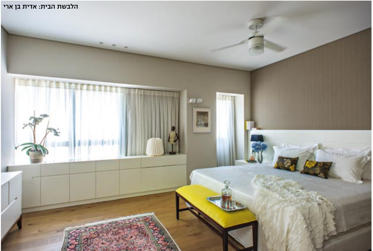
הלבשת הבית: אדית בן ארי